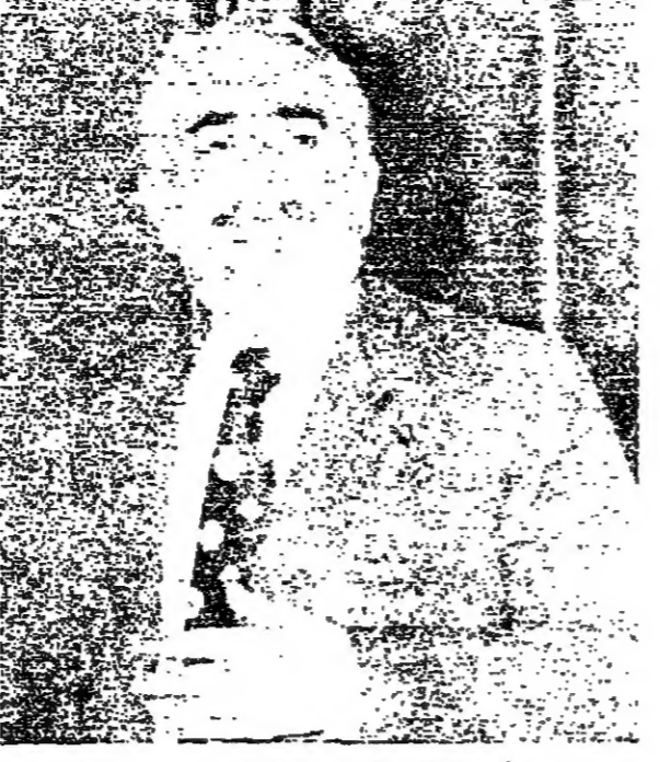
الجنرال ميشال جنبلاط

تسهر الاتصالات المكثفة بين مختلف الأطراف السائدة للوصول الى اتفاق حول القواسم المشتركة التي أعلنها عنها الرئيس رشيد كرامي لحل الأزمة. وسعدت جلسات الوزراء جلسته قبل ظهر اليوم في اجراء محافظة استناداً الى المواقف المؤجزة عن استمرار التعاون بين الرئيس سليمان فرنجية والرئيس رشيد كرامي. وقد ابلغ رئيس الحكومة السيد صائب سلام وزيراً ايراحه الى العلاقات الثنائية بينه وبين رئيس الجمهورية، وتال ما مضى من التوصل في المواقف التي تحتضنها وان الموقف الى التوافق معاً. الا ان رئيس الحكومة ابدى انزعاجه من مواقف السيد كمال جنبلاط تجاهه وقال ان الظروف الراهنة تعرض على الجميع ان يفتروا خط الاجابة بدل ما يتفاوضوا والواجب في المواقف من ان يحاولوا استغلال الظروف المتغيرة على ما كانه شخصية خاصة وان البلاد لم تعد تتحمل مزيداً من النزف الامم الذي اصاب الجميع. وتساؤل كرامي كيف يطلب البعض من رئيس الحكومة ان يتخذ مواقفهم من غير ان يتفهموا الى قضايا وطنية اساسية وحسابات بينها بطولونيه من حيث تاليه ان يرفع مطالبات من طراز التي اقصى برجاهه. وتكررت مصادر رئيس الحكومة بان رئيس الجمهورية يتفهم مع حصول التوافق الاساسية التي يستتقنها القاسم المشترك لحل. وان مجلس الوزراء ناقش في عدة جلسات سابقة هذه النقاط واطبق رئيس الجمهورية ورئيس الحكومة كلا بعدهم فكرة التوافق مع كمال جنبلاط التي يراها افضل المصالحات المتبادلة في وقتها.